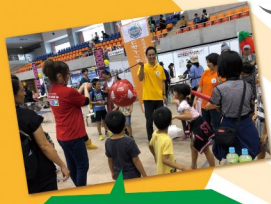
中国・メキシコ・ ペルー等世界の遊びで 楽しもう!