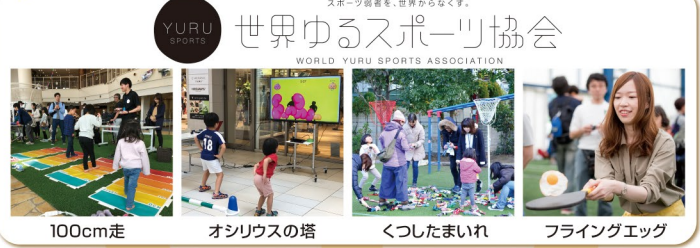
100cm走 オシリウスの塔 くつたまいれ フライングエッグ