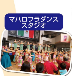
マハロフラダンス スタジオ