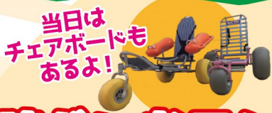
当日は チェアボードも あるよ!