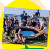
ガンボール サバニ