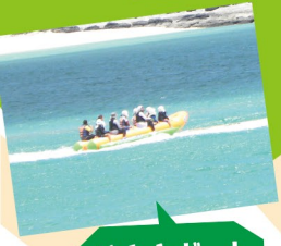
バナナボート 体験