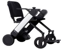
WHILL Model F