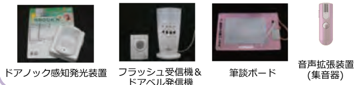
ドアロック感知発光装置