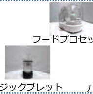
フードプロセッサー